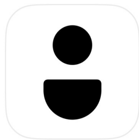
かんたん予約 (旧 Coubic) Coubic Inc.

「かんたん予約」というアプリにてアカウントを作成していただけます。 アプリで登録していただくと、登録後の予約がアプリひとつで行なえます。 手順について記載されたサイトをご覧ください。